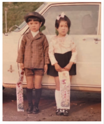
(右は一つ違いの妹です)

今、大人になった僕の膝には、もう絆創膏はありません。でも、あの頃の泥だらけの思い出は、僕の心の中に、かけがえのない宝物として輝き続けています。