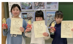
3年生の部 優勝 水元小学校

令和6年度かつしか郷土かるた 水元地区予選大会 令和7年1月18日(土)水元地区センターで、かつしか郷土かるた水元地区予選大会を開催しました。水元小学校、原田小学校、花の木小学校、東水元小学校から3年生の部、4年生以上の部のそれぞれ代表チームが出場しました。競技中は緊張の空気の中で子どもたちの札をとるぞーという表情、体からあふれるエネルギーでいっぱいになっていました。 試合の結果は3年生の部は水元小学校、4年生以上の部は原田小学校が優勝し2月15日に開催予定の全区競技大会に水元地区委員会代表として出場します。