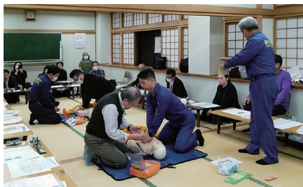
水元地区委員会委員研修会のようす

AEDを使い、実際の現場で救護をする設定で、実践しながらの訓練を行うことができました。