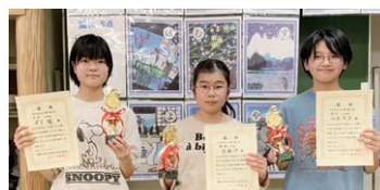
4年生以上の部 優勝 原田小学校