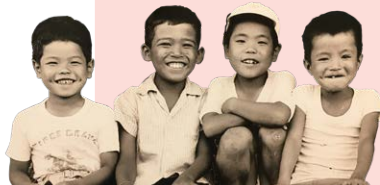
スナゴローボーイズ