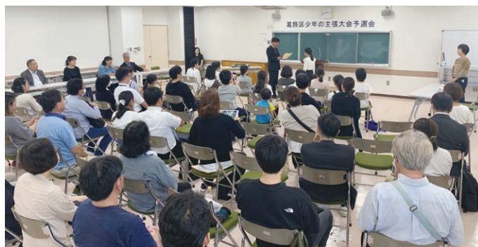
水元地区予選会のようす