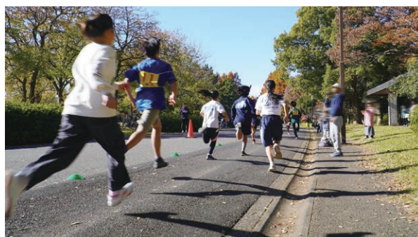
水元公園を駆け抜ける選手たち (水元地区ふれあいロードレース大会にて)